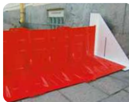
▲サイドアタッチメント