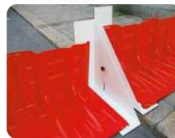
▲段差対応アタッチメント