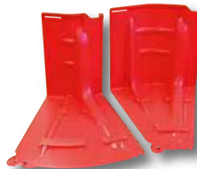
アウトコーナー(左) インコーナー(右) ▶